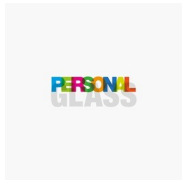
ACCESSOIRES PERSONAL GLASS