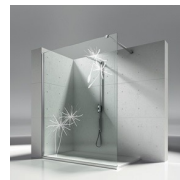
NATUURLIJKE DECORS P19 BLOW