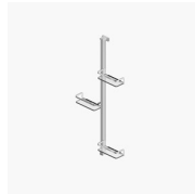
UITGERUSTE KOLOM BASKET