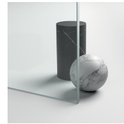
GLAZEN 12 - EXTRAHELDER GLAS