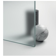
GLAZEN 08 - GESATINEERD GLAS