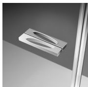
DEURKNOPPEN EN HANDGREPEN M6T STANDARD