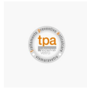
ANTI-KALKBEHANDELING VOOR PREVENTIEVE KALKWERENDE BEHANDELING (TPA)