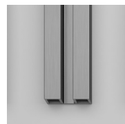
PROFILI COLORI METALLICI 61 - FINITURA ACCIAIO SPAZZOLATO