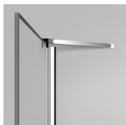
STAFFA DI IRRIGIDIMENTO Q