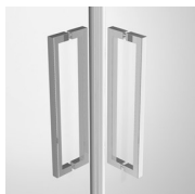
MANIGLIE M11F STANDARD