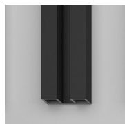
PROFILI COLORI METALLICI 09 - NERO OPACO