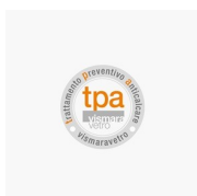
TRATTAMENTO ANTICALCARE TRATTAMENTO PREVENTIVO ANTICALCARE (TPA)