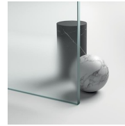
CRISTALLI TEMPERATI SPECIALI 29 - CRISTALLO MADRAS NUVOLA