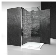
DECORI GRAFICI D55