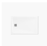
PIATTO DOCCIA VI.P