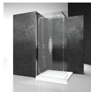
DECORI GRAFICI P56