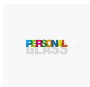
ACCESSORI PERSONAL GLASS