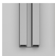
PROFILI COLORI METALLICI 31 - ARGENTO SATINATO