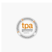
TRATTAMENTO ANTICALCARE TRATTAMENTO PREVENTIVO ANTICALCARE (TPA)