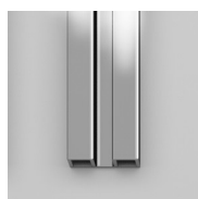
PROFILI COLORI METALLICI 21 - ARGENTO LUCIDO