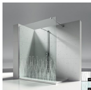
DECORI NATURALI P15 ORGANIC