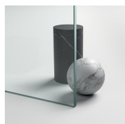
CRISTALLI TEMPERATI 04 - CRISTALLO TRASPARENTE