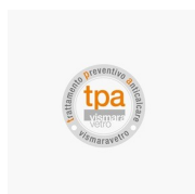
TRATTAMENTO ANTICALCARE TRATTAMENTO PREVENTIVO ANTICALCARE (TPA)