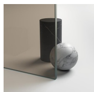
CRISTALLI TEMPERATI 03 - CRISTALLO BRONZO