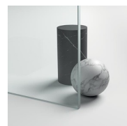
CRISTALLI TEMPERATI 12 - CRISTALLO EXTRA-CHIARO