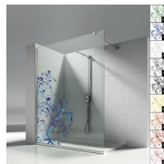
DECORI NATURALI P16 AZULEJOS