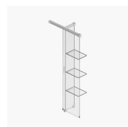
PARETE DIVISORIA SCREEN