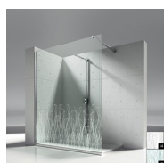
DECORI NATURALI P15 ORGANIC