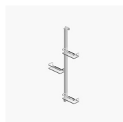
COLONNA ATTREZZATA BASKET