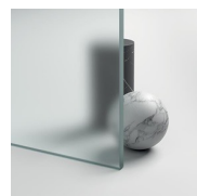
CRISTALLI TEMPERATI 08 - CRISTALLO SATINATO