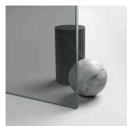
CRISTALLI TEMPERATI 07 - CRISTALLO GRIGIO