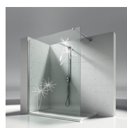
DECORI NATURALI P19 SOFFIO