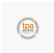
TRAITEMENT ANTI- CALCAIRE TRAITEMENT PRÉVENTIF ANTICALCAIRE (TPA)