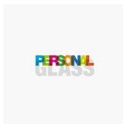
ACCESSOIRES PERSONAL GLASS