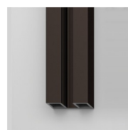
PROFILÉS ANODISÉS 38 - MOKA