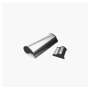
ACCESSOIRE DE NETTOYAGE VIRGOLA