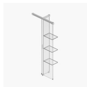
PAROI DE SÉPARATION SCREEN