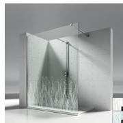
DÉCORS NATURELS P15 ORGANIC