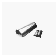
ACCESSOIRE DE NETTOYAGE VIRGOLA