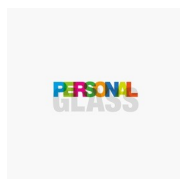
ACCESSOIRES PERSONAL GLASS