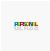
ACCESORIOS PERSONAL GLASS