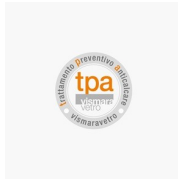
TRATAMIENTO DE PREVENCIÓN ANTICALCAREO TRATAMIENTO PREVENTIVO ANTICALCAREO (TPA)