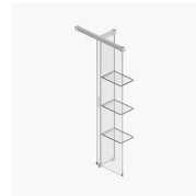
PANEL SEPARADOR SCREEN