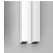
PERFILES ESMALTADOS 14 - BLANCO