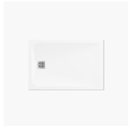
PLATO DE DUCHA V.I.P.