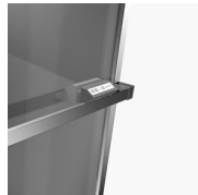
ACCESORIOS PARED RADIANTE